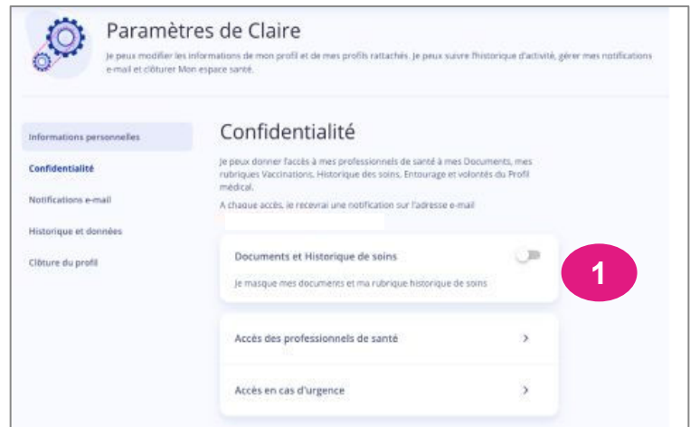
Gestion de la confidentialité et possibilité de masquer en un clic l'ensemble des documents

→ Un patient peut bloquer un professionnel de santé :